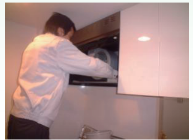
4. 部品取り付け及び 本体清掃・点検