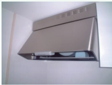
1. レンジフード清掃 お申し込み

※作業のお支払いは、●月分の管理費等と共に●●年●月に所定の預金口座から自動振替させていただきます。