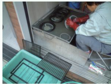
3. 取り外し部品洗浄